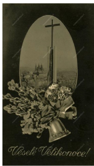
Velikonoční pohlednice 1948. MMP inv.č. MMPH 154.066