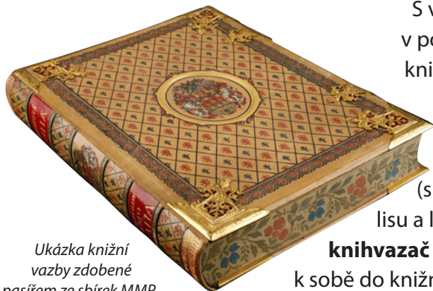
Ukázka knižní vazby zdobené pasířem ze sbírek MMP. Inv. č. H 026 285

S vynálezem knihtisku v polovině 15. století se knihy začaly rychle šířit a staly se dostupnější. Vznikly nové profese: tiskař (s pomocí tiskařského lisu a liter tiskne na papír), knihvazač (potištěné listy váže k sobě do knižní vazby) nebo pasíř (zdobí vazbu textilními nebo kovovými pasy).