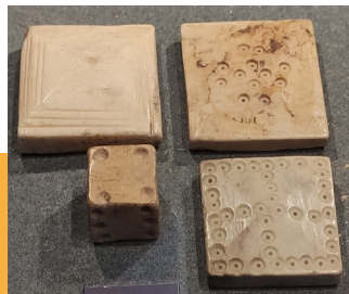
Kostěné „kameny“ a kostka ze sbírek Muzea hl.m. Prahy