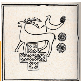
Nákres kachle s hracím plánem Ovčince