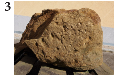
Pískovcový kvádr MMP H 239.417/2