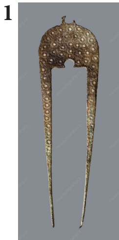
Ramínko vah MMP A 78/2002-2