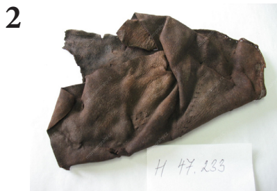
Fragment (zlomek) kůže MMP H 047.233