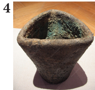
Tyglík - nástroj na odlévání kovů MMP H 018.771