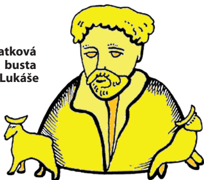
ostatková busta sv. Lukáše