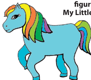
figurka My Little Pony