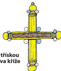
kříž s třískou z Kristova kříže