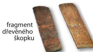
fragment dřevěného škopku