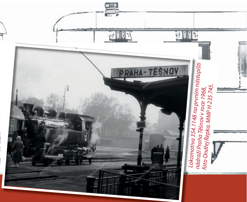
Lokomotiva 354.1148 na prvním nástupišti nádraží Praha - Těšnov v roce 1968. foto Ondřej Jřepka, MMP H 235 745.

Muzeum hlavního města Prahy má ve svých sbírkách i jedinečný velký model nádraží Praha - Těšnov .