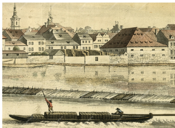
Národní 2, Praha 1, MMP, inv. č. H 045028 (výřez)