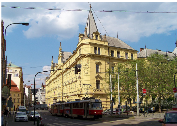
Městský soud ve Spálené ulici, fotografie z veřejně dostupných zdrojů.