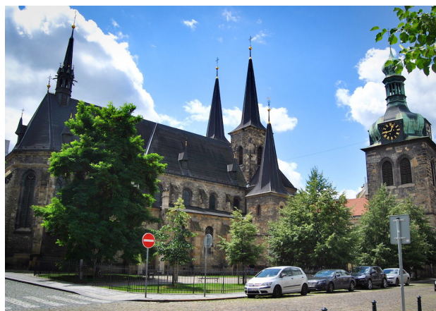
Parčík u kostela v Petřské ulici, fotografie z veřejně dostupných zdrojů.