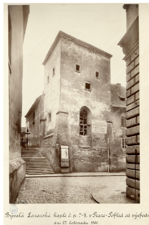
Karlovo nám., Spálená ulice, Lazarská ulice, MMP, inv. č. H013197