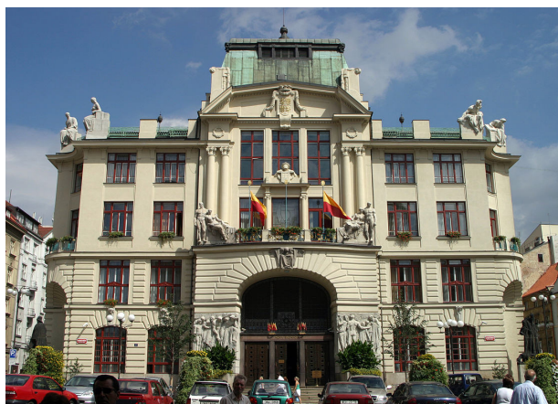
Budova magistrátu hl. m. Prahy na Mariánském náměstí