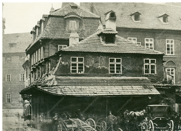
Mariánské náměstí 2, MMP, inv. č. H121514