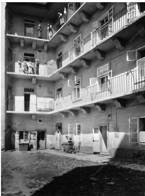
inv. č. H 342306, kolem 1960

S rozvojem průmyslu rostly v 19. století na okrajích velkých měst továrny, v nichž hledali obživu hlavně mladí lidé z venkova. V 19. a na počátku 20. století bydlely dělnické rodiny na pražských předměstích především v pavlačových domech. Tyto domy měly obvykle v přízemí společné suché záchody a na dvoře pumpu na vodu. Z pavlače se vstupovalo přímo do bytu. Ten měl většinou jen jednu místnost, která sloužila jako kuchyně, ložnice i obývací pokoj. V jedné místnosti žilo obvykle nejméně pět osob.