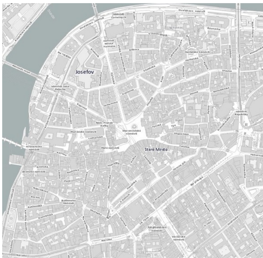
Mapový podklad IPR Praha, 1:5000.

[ Ghetto – uzavřená část města vyhrazená pro židovské obyvatele ]