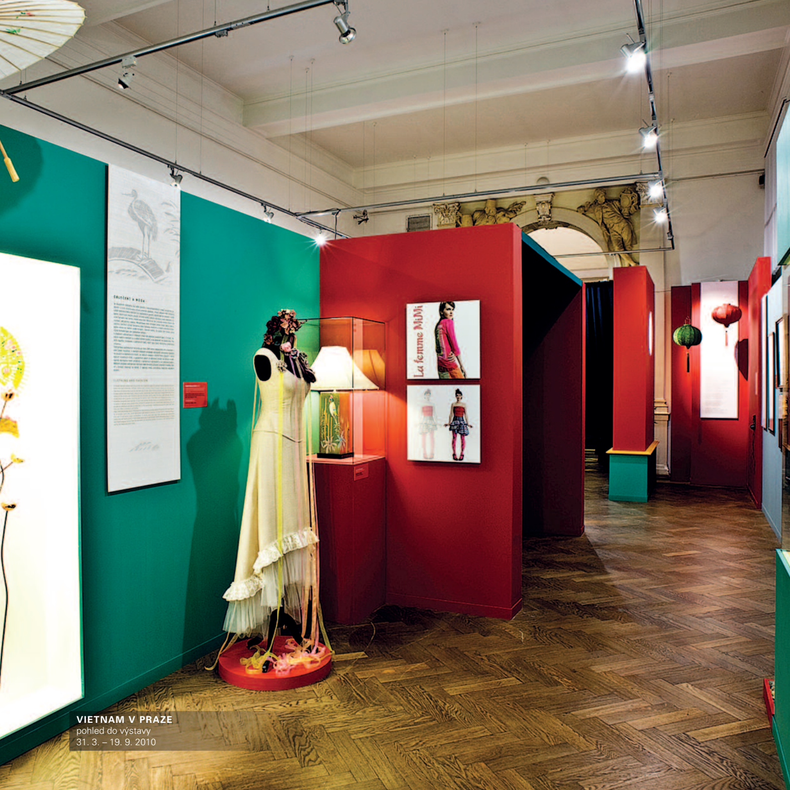
VIETNAM V PRAZE pohled do výstavy 31. 3. – 19. 9. 2010