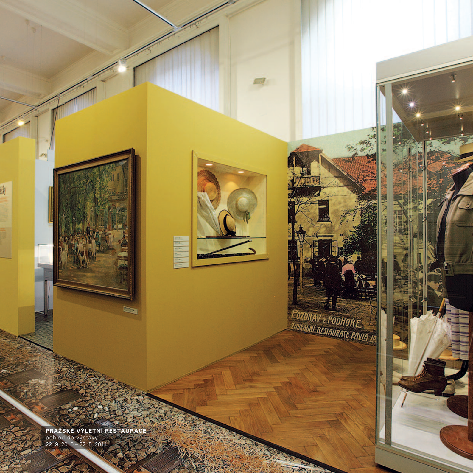
PRAŽSKÉ VÝLETNÍ RESTAURACE pohled do výstavy 22. 9. 2010 – 22. 5. 2011