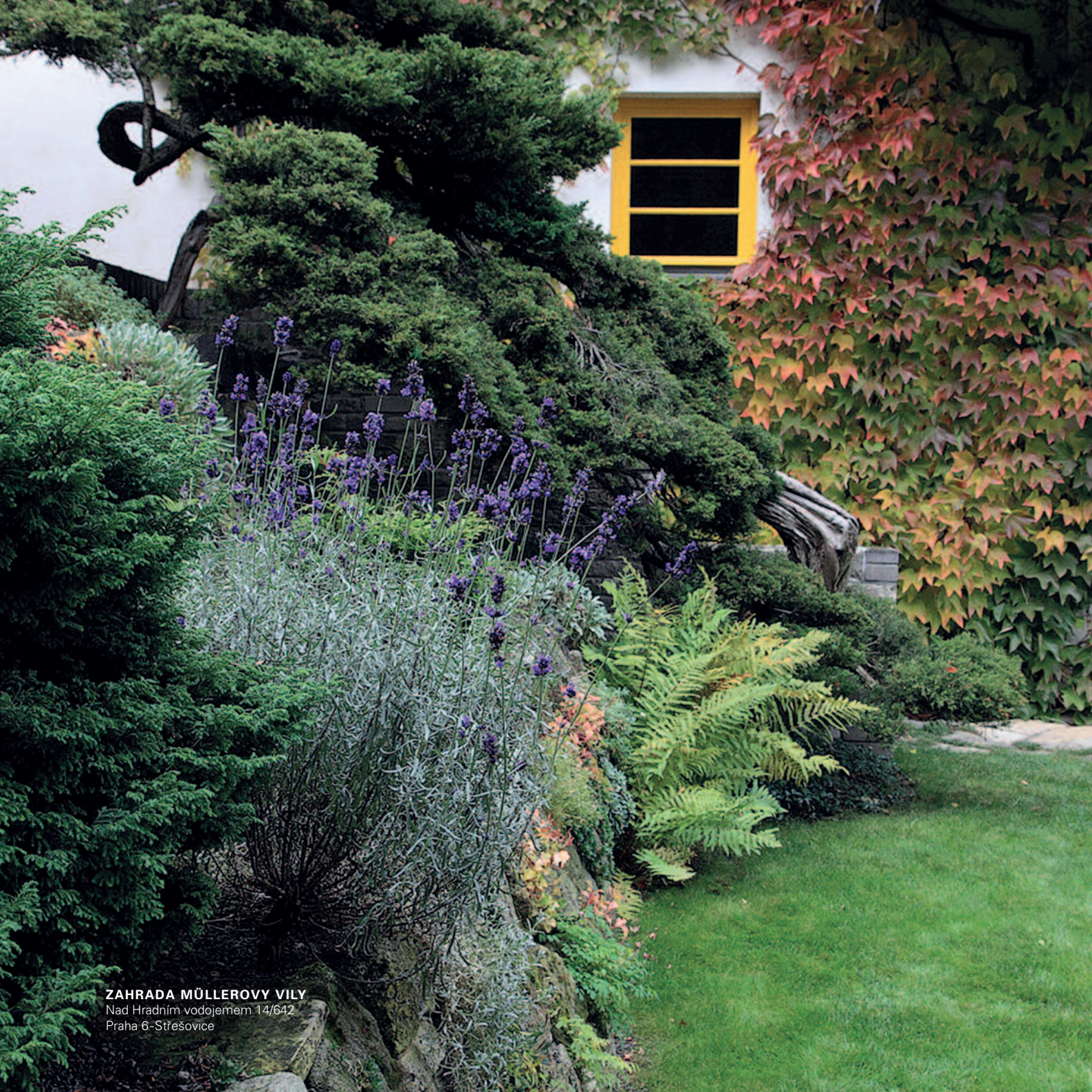
ZAHRADA MÜLLEROVY VILY Nad Hradním vodojemem 14/642 Praha 6-Střešovice