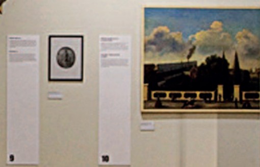
KARLÍN – NEJSTARŠÍ PŘEDMĚSTÍ PRAHY pohled do výstavy 11. 5. 2011–6. 11. 2011