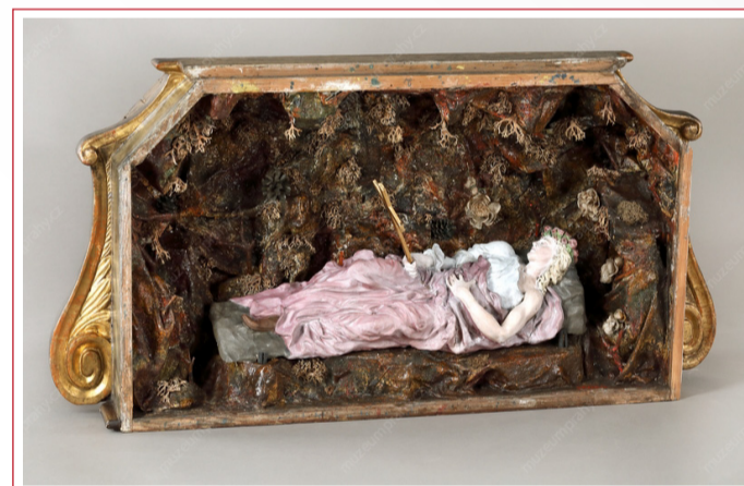
Sv. Rozálie, první polovina 18. století, s pozdějšími doplňky, terakotová socha, dřevěná vyřezávaná skříňka, z farního kostela na Zlíchově

Legendární světec Roch se údajně narodil v roce 1295 v jižní Francii, po smrti rodičů se vydal do Itálie, kde pomáhal nemocným morem. Sám se nakazil, odešel do ústraní, kam mu pes nosil jídlo a Roch se uzdravil. Uctíván byl již v 15. století zejména v Benátkách, v Itálii, ve Francii a v Německu, a jeho kult se postupně rozšířil. Sv. Šebestián šířil křesťanství ve 3. století v Římě, kde ho císař Dioklecián dal nejprve zabít lukostřelci, což světec přežil, ale posléze byl na příkaz císaře ubit k smrti. Na místě, kde spočinuly jeho ostatky, byla později postavena bazilika San Sebastiano fuori le mura. Bývá zobrazován jako spolupatron proti moru.