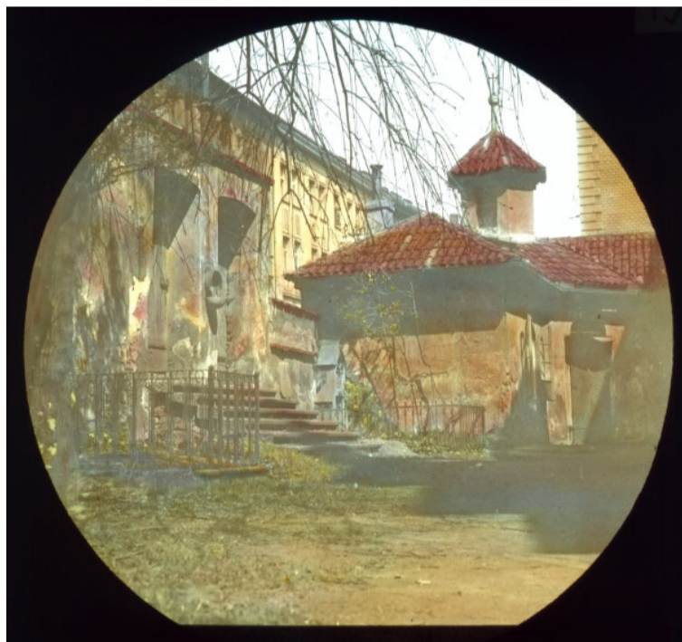
Kaple sv. Rocha, patrona nemocných morem, u vchodu a Malostranský hřbitov v Košířích, zbořena 1953 při rozšiřování Plzeňské třídy, diapozitiv, 1917, MMP HND 191