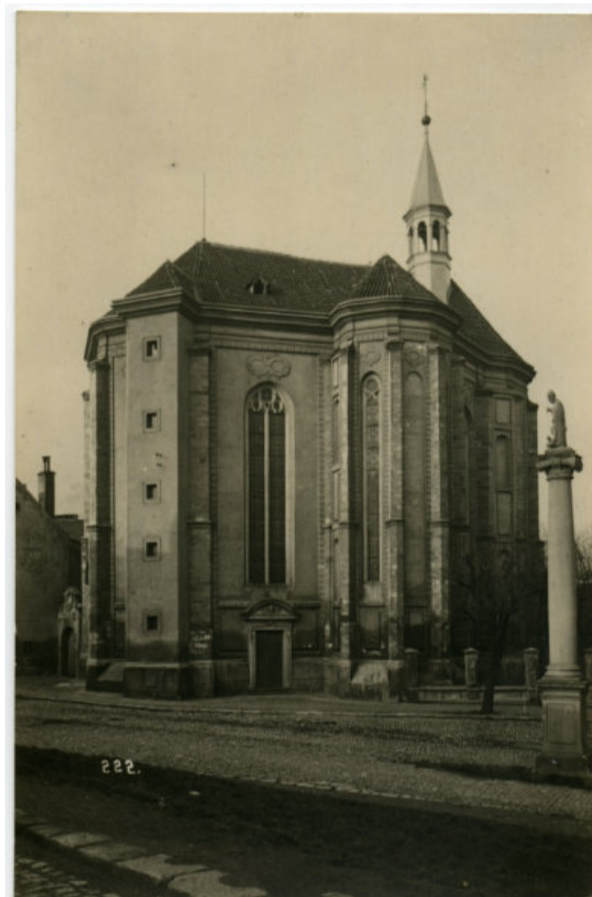
Kostel sv. Rocha na Strahově, se sochou sv. Norberta, fotografie, MMP H 100.352