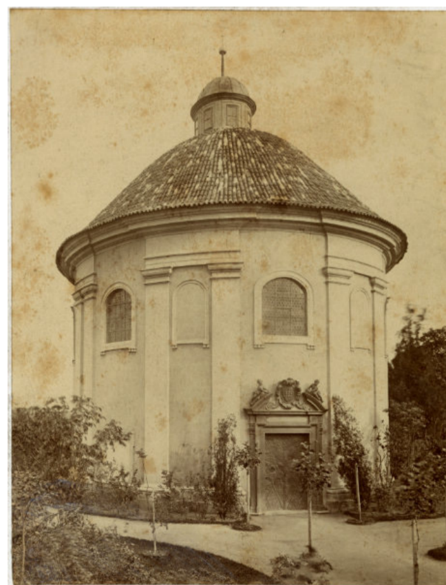
Pohled na kapli sv. Rocha na Olšanech, foto Jindřich Eckert, kolem 1895, MMP 45.287