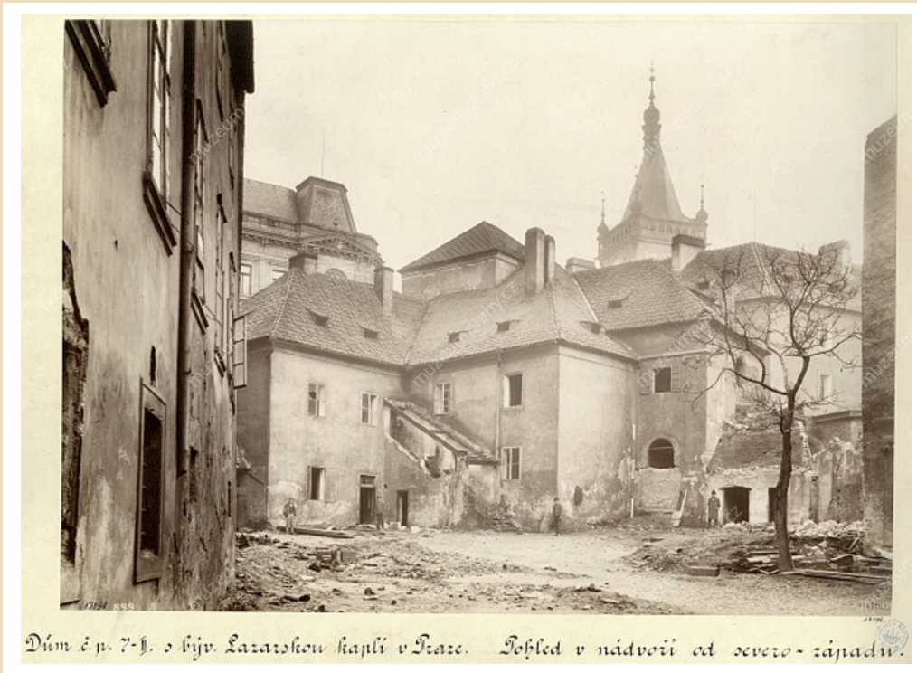
Dům č.p. 7-1. v býv. Lazararstovské kapli v Praze. Zpřesled v nádvoří od severo-západu.

Pozůstatky pražského středověkého špitálu u sv. Lazara se nalézaly v prostoru mezi Novoměstskou radnicí a ulicemi Lazarskou a Spálenou, foto kolem 1900. MMP 13.198