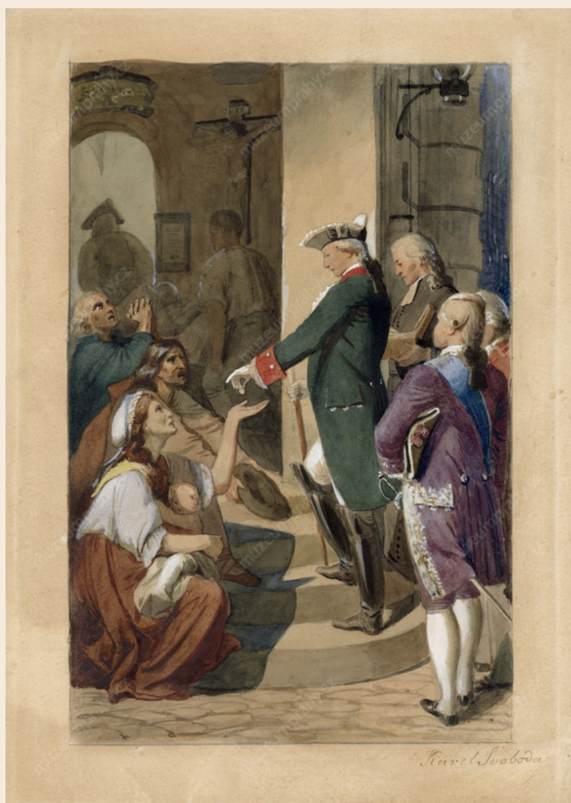
K. Svoboda, (Budoucí císař) Josef II. uděluje almužnu chudým v době hladu r. 1772, akvarel na papíře, kolem poloviny 19. století. MMP 61.224

Alois Jirásek, Staré pověsti české, O Přemyslovi