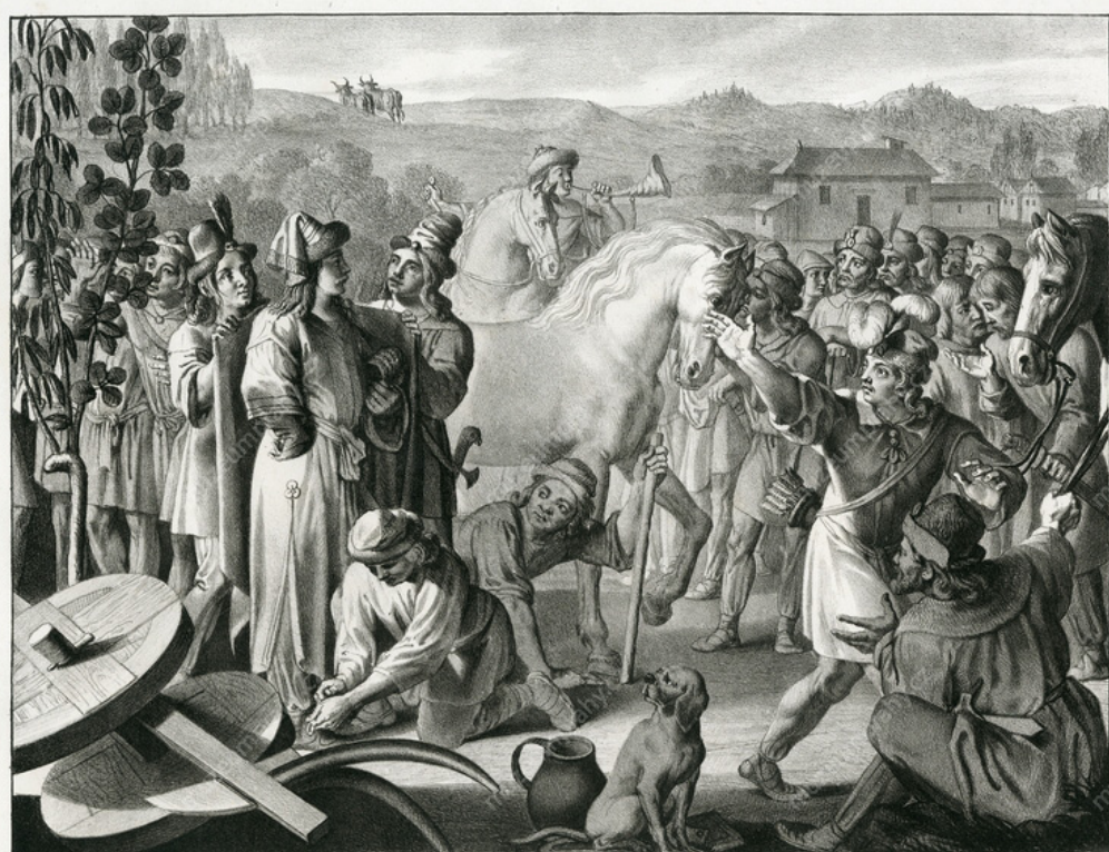
Útolení Přemysla za Českého vévodu. Die Uähl des Přemissls zum Herzoge von Böhmen.

V raném a vrcholném středověku bývala totiž zásobovací situace společnosti natolik křehkou záležitostí, že větší klimatická nerovnováha znamenala vždy neúrodu a hlad. V době nepříznivých zásobovacích poměrů umírali lidé i na některé choroby, někdy docela banální. Nejkritičtější zásobovacím obdobím byl sklonek zimy a první jarní měsíce. V době pozdního středověku se změnou zemědělských technologií již hladomory většinou neměly tak fatální následky, jako zničující jmenují ovšem kronikáři situaci v letech 1572 či 1590. První polovina 17. století proběhla ve víru válek, které s sebou přinášely nebo alespoň umocňovaly některé "přidružené" kalamity; nedostatek potravin byl celkem běžnou záležitostí. Ve druhé polovině 17. století zaznamenaly prameny neúrodná léta 1677, 1684 a 1692–1696. V 18. století pak došlo ke dvěma velkým potravinovým kalamitám, v roce 1736 (místně spojeno s hromadnou otravou námelem) a v letech 1771–1772. Hospodářské potíže nastaly pak v prvních letech 19. století v době napoleonských válek. O hladových letech se pak hovoří v dalších neklidných dobách, v letech 1847–1849, v době prusko-rakouské války a v roce 1873.