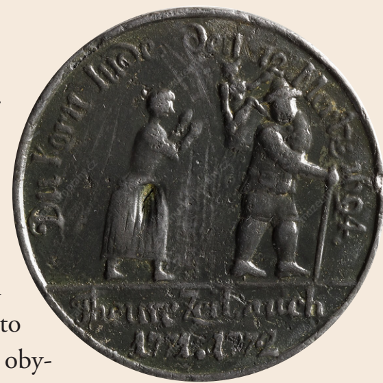
Pamětní medaile na drahotu let 1694, 1771 a 1772. MMP 467

Kronikáři až do poloviny 14. století zaznamenávají zvýšenou úmrtnost téměř výlučně v souvislosti s hladem a souvisejícími nemocemi. Pojem mor v kronikách české provenience je používán ve smyslu "mření", což souvisí s latinským mors – smrt; obdobný je i širší význam latinského slova pestis (morová nákaza, mor, nakažlivá nemoc, zhouba). O zničujících hladomorech se české kroniky zmiňují ve zvýšené míře ve druhé polovině 13. a v první polovině 14. století, ohromný hladomor zažily Čechy i okolní země v letech 1281–1282, v Čechách a v Praze byl umocněn braniborskou okupací. Drastická v tomto směru byla i léta 1316–1318. Jako o skutečně katastrofálních z hlediska zásobovací situace obyvatel lze hovořit o přírodních podmínkách v letech 1430 – zima 1434. Jednalo se navíc o léta válečná. Od pokročilého 15. století se hladomor ve větším měřítku objevoval většinou spíše lokálně, v souvislostech s útrapami válek a větších epidemií.