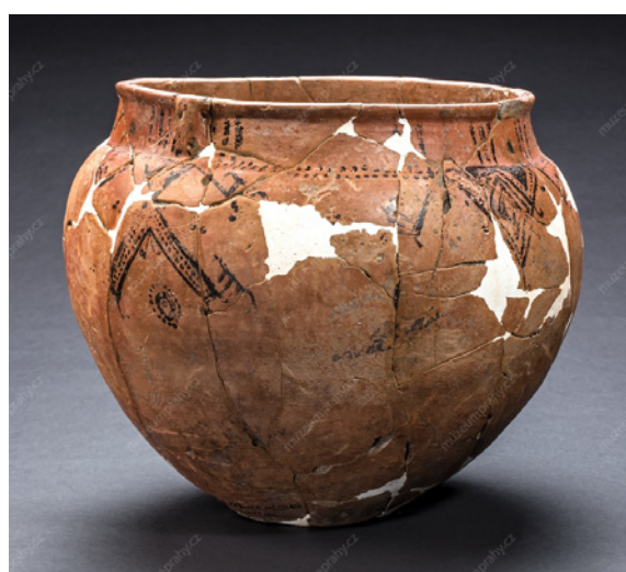
Hluboká mísa neboli terina oblé profilace byla objevena ve fragmentech při archeologickém výzkumu Muzea hlavního města Prahy v roce 2000 v Praze-Ďáblicích. Terina má typické odsazené kuželovité hrdlo a malé „nepravé“ ucho (ucho je k nádobě připojené celé, bez mezery). Černě malované motivy trojúhelníků, vyplňovaných pásů a slunce jsou nanášeny na červeném podkladu. Výška nádoby je 20 cm, průměr jejího ústí činí 19,5 cm (inv. č. A 209 524).