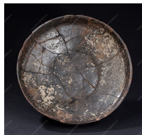
Mísa z Prahy-Střešovic byla nalezena v kostrovém hrobu v zaniklé cihelně pana Hnáta. Mísa má povrch ošetřen tuhou, což je kromě několikrát zmíněného malování další velmi oblíbený způsob zdobení nádob, který známe už předchozí doby bronzové. Tuhování nádobám propůjčovalo stříbřitý lesk, což působilo obzvláště efektně dohromady s jemnou rytou výzdobou. Mísa má průměr 26,6 cm a výška nepřesahuje 7 cm (inv. č. A 1243).