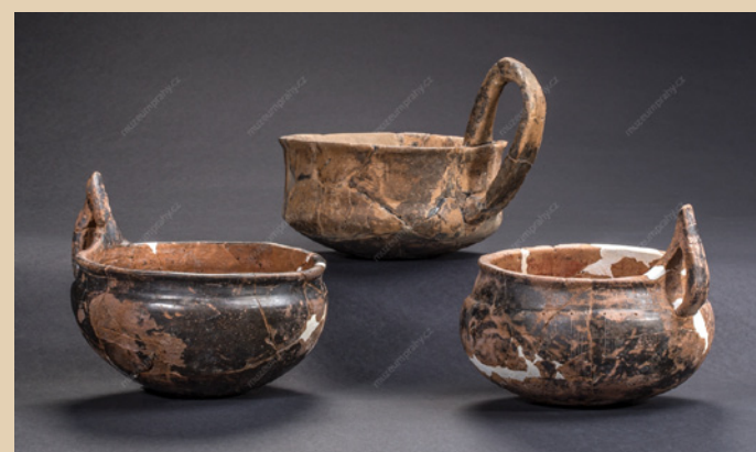
Soubor keramických koflíků s převýšenými uchy z pražských pohřebišť doby halštatské (800–480 př. n. l.; zleva: inv. č. A 209 666; A 124 048; A 209 538).

Stejnou kreativitu jako v případě výzdoby vložili hrnčíři doby železné i do tvarového spektra nádob. Zastavme se krátce u koflíků s převýšenými uchy. Na obrázku je vidět trojice koflíků bylanské kultury doby halštatské, z nichž dva pocházejí z archeologického výzkumu Muzea hlavního města Prahy v Ďáblicích. Účel těchto nádob se dá dobře pochopit z jejich tvaru, výrazná profilace ucha pak zdůrazňuje jejich mimořádný charakter. Hodování a ceremoniální přípitek, ke kterému byly podle všeho tyto koflíky určeny, představoval v prehistorickém i starověkém světě klíčový prostředek k navazování a udržování vztahů mezi živými. Podle celé řady indicií věříme, že jejich význam smrti neztrácel. Velkou oblibu měly alkoholické nápoje – doloženu máme v době halštatské např. medovinu, ale vzhledem ke stoupajícím obchodním a diplomatickým vztahům s mediteránním prostředím připadá v úvahu i víno.