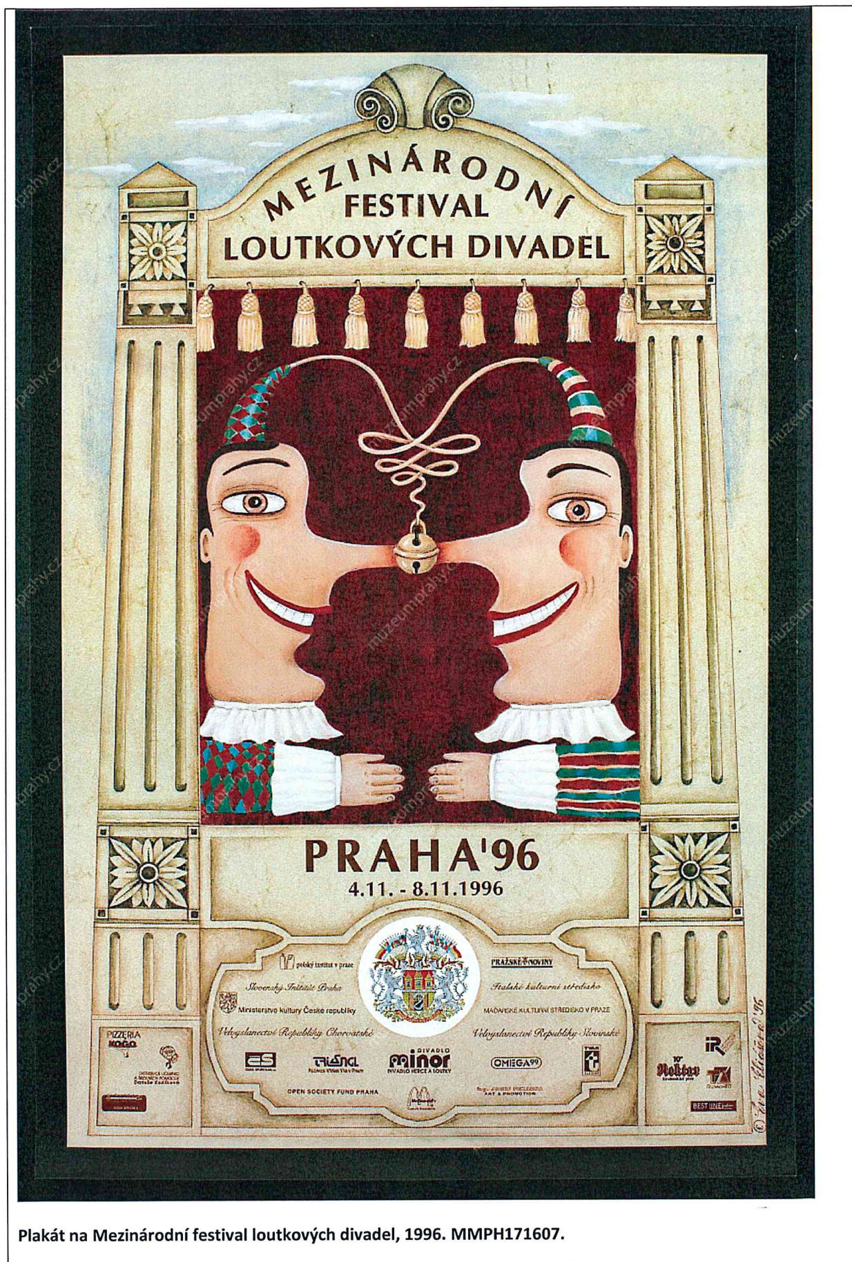
Plakát na Mezinárodní festival loutkových divadel, 1996. MMPH171607.