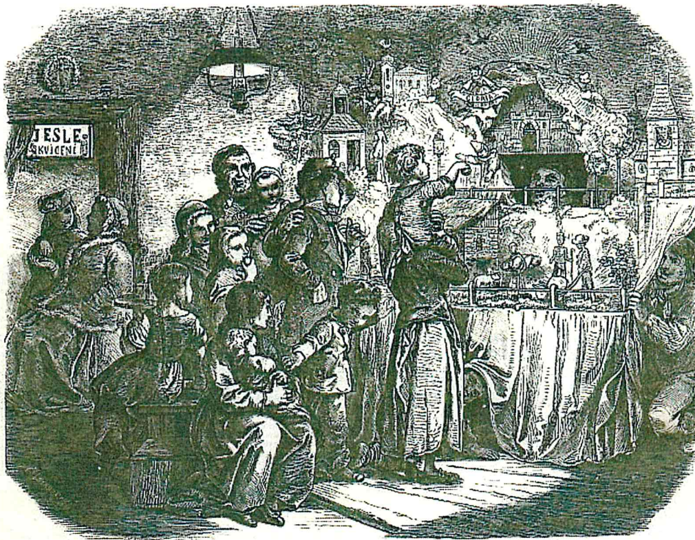
Takzvané jesle – pražské loutkové specifikum. Květy 1867, č. 25, s. 212.