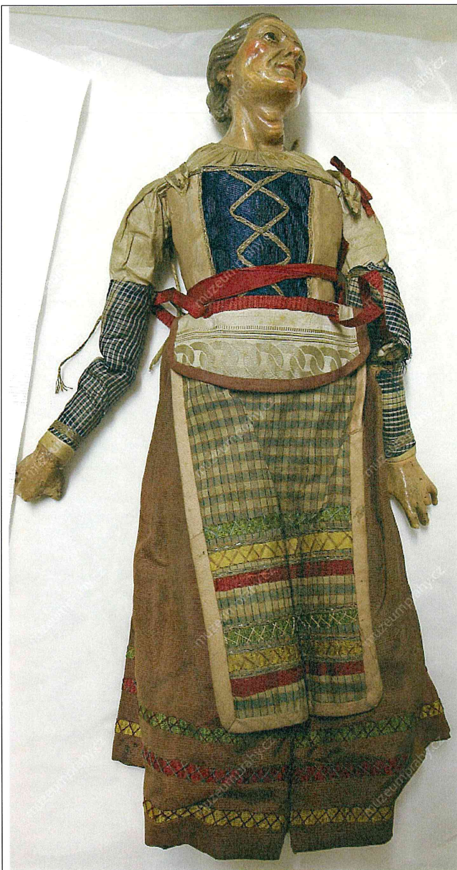
Barokní dřevěná loutka, 2. pol. 18. století. MMPH42656.