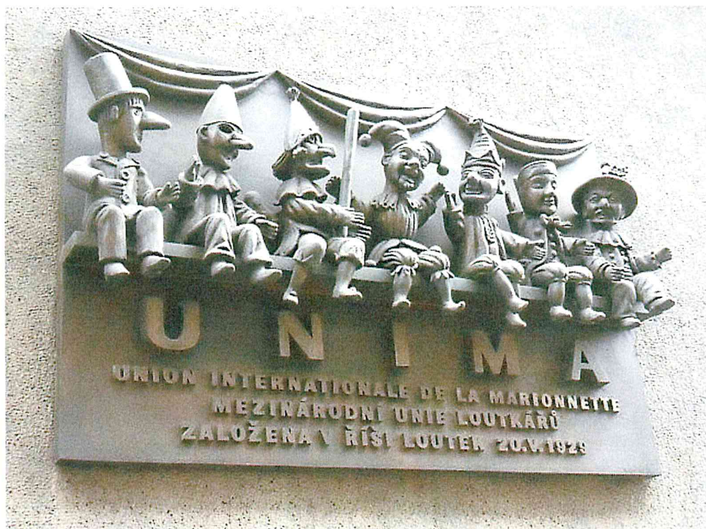
Pamětní deska k založení UNIMA v Žatecké ulici.